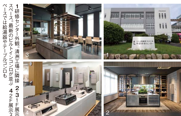
ビルトインコンロやテーブルコンロが並ぶ1F展示スペース。写真奥のキッチンコーナーでは、調理実演もできる

「販売力・営業力を強化したい」と いうニーズの高まりから、商談に役立 つ話法の習得や、ガス機器販売の現場 に即したヒアリング力の養成など、独 自のメニューも実施。全国の研修セン ターと連携しながら、新人研修、間接 部門の社員向け研修など、お客さまの 要望に応えた研修を実施します。