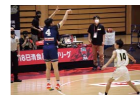
「U18日清食品リーグバスケットボール競技大会」の様子