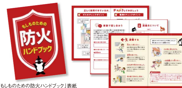
「もしものための防火ハンドブック」表紙

パロマでは、9月1日の防災の日にも「もしものための防火ハンドブック」を名古屋市立の小学校に通う小学4年生・5年生に配布しました（全266校、約37,000人）。このハンドブックでは、火事を防ぐための備えや、身の回りの出火原因のチェックポイントといった事前準備、火事が起きた時の対応などを学ぶことができます。子どもが理解するだけではなく、家庭での話し合いや家族がともに取り組むことを促す内容になっています。