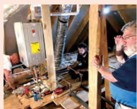
「高効率給湯器」の設置現場の様子

アメリカではガス給湯器を室内に設置するのが一般的。ユーザーさまには「デザインがかわいい」「音が静か」と喜ばれています。また、施工業者さまからは「施工が簡単」と評判です。