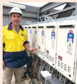
商業施設に連結して設置していただいた27号の給湯器と、施工者様

施工業者さまからは「定期的なトレーニングがあるから安心」、ユーザーさまからは「アフターサービスが迅速」との声が届いています。