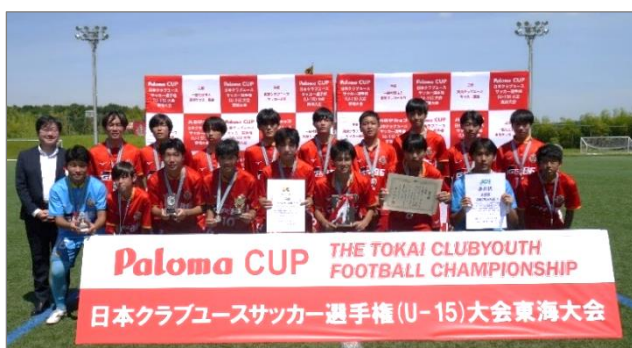
名古屋グランパス U-15