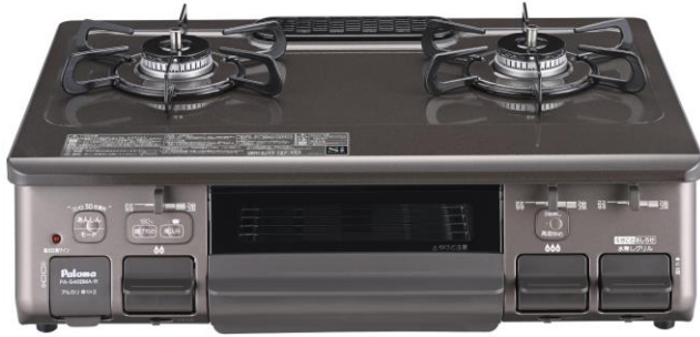
<天板クリスタルブラウン×本体メタリックブラウン>