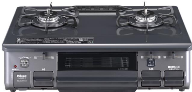
<天板ニュートラルグレー×本体グラファイトブラック>