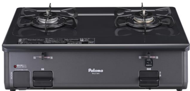
<天板ニュートラルグレー×本体グラファイトブラック>