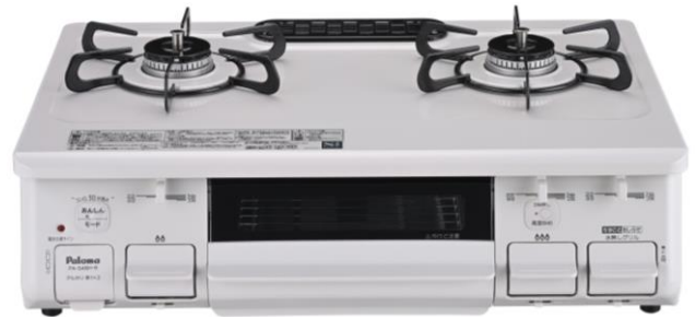
<ナチュラルホワイト>