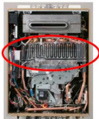
壁面火災防止装置

スリムタイプの給湯器はマンションなどの狭小スペースに設置されることが多いため、雨どいなどの可燃物との離隔距離が確保しづらいことがあります。T-ino SLIM にはパロマ独自の安全装置「壁面火災防止装置」を搭載しているため、可燃物からの離隔距離が通常は側方 15cm 以上必要であるところ、1cm での設置が可能な防火評定を取得できました。一般的な過熱防止装置は、温度ヒューズが点で異常過熱を検知する仕組みであることに対し、壁面火災防止装置は面状の温度ヒューズを用いることで、給湯器内部のどの箇所で異常