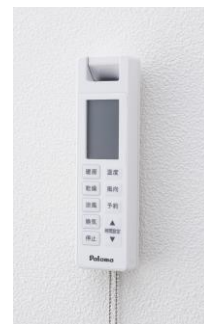
↑ ぶらさがリモコン