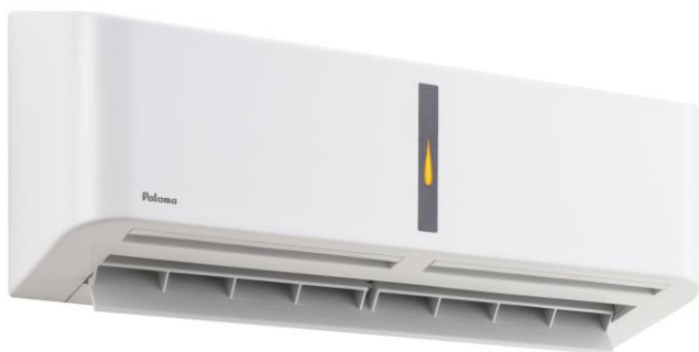
↑ 本体（暖房・乾燥運転時）