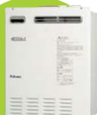
(給湯器 エコジョーズ)