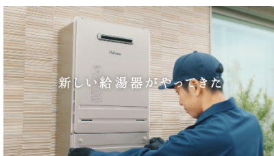
新しい給湯器がやってきた

（動画リンク・QRコード） https://youtu.be/RhxJ5yp3uOE