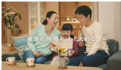
家族の時間を、あたためる。