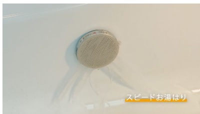
スピードお湯はり