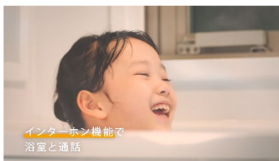
インターホン機能で 浴室と通話