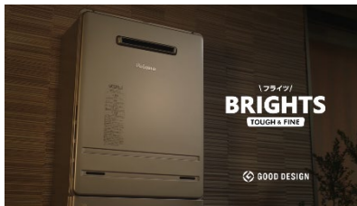
「ブライツ」 BRIGHTS TOUGH & FINE GOOD DESIGN