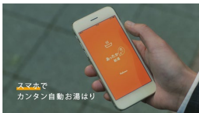
スマホで カンタン自動お湯はり