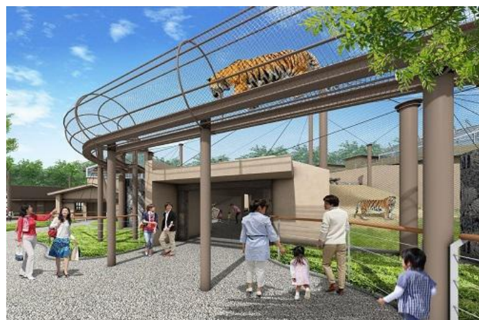
新トラ舎 屋外運動場（イメージ）

新トラ舎は広い屋外運動場と、スマトラトラの生態や特徴を学ぶ事ができる学習展示施設などを兼ね備え、来場された方々がより一層動物に親しみ、生命や自然環境の大切さを体感・体験できる機会を提供し、喜んでいただける施設になると考えています。