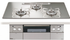
ラ・クックグラン同梱 代表器種: PD-962WT