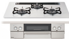
ラ・クックグラン別売 代表器種: PD-819WS