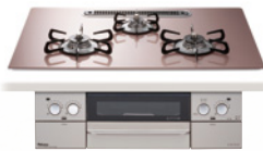
ラ・クックグラン同梱 代表器種: PD-862WS/872WT