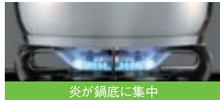
炎が鍋底に集中 エコフラットバーナー