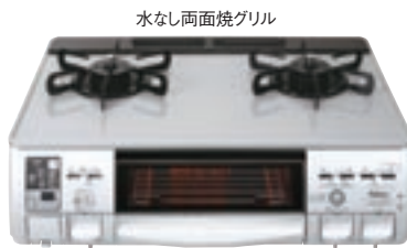
水なし両面焼グリル