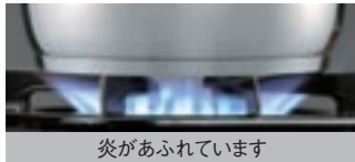
炎があふれています 従来のコンロバーナー