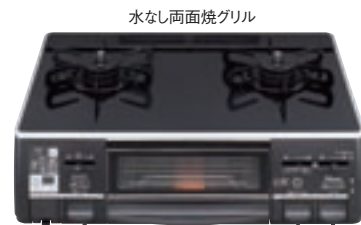
水なし両面焼グリル