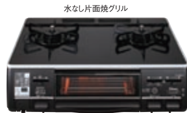
水なし片面焼グリル